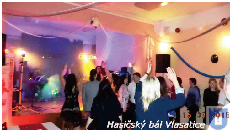
Hasičský bál Vlasatice

Děkujeme všem dárcům a sponzorům a rádi bychom touto cestou poděkovali všem lidem, kterým není práce hasičů lhostejná a pomáhají nám.